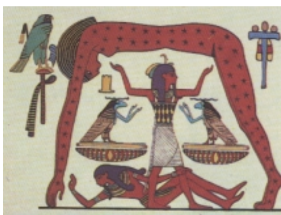
Figura 1.- Motivo egipcio para representar la creación; que incluye a Geb, el dios de la Tierra, a Shu, el dios de la luz y el aire, y Nut, la diosa del cielo.

Los primeros argumentos de corte analógico podemos encontrarlos en las explicaciones cosmológicas de las civilizaciones más arcaicas. Como sabemos, la concepción del mundo que tenían cosmologías como la hindú o la egipcia, descansaban con frecuencia en metáforas y símiles de carácter antropomórfico y estaban repletas de alusiones alegóricas a dioses, hombres y animales (figura 1). Las propias constelaciones estelares se definieron a partir de formas humanas, animales u objetos y utensilios familiares.