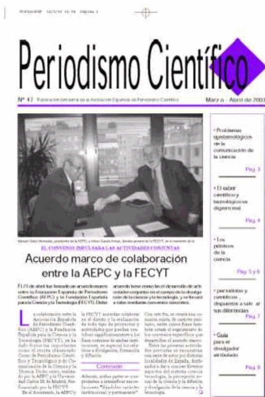
Figura 1.- Portada del número 47 de Periodismo Científico

Según lo expresado por su director en el primer número (Calvo, 1994), los objetivos de Periodismo Científico pueden sintetizarse en: