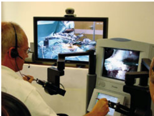
Panel de mando en New York

Las ondas electromagnéticas, que son las que transportan la información, tardan un tiempo en viajar de un sitio a otro. También la luz, que es una onda electromagnética, tarda en viajar de un punto a otro un cierto tiempo.