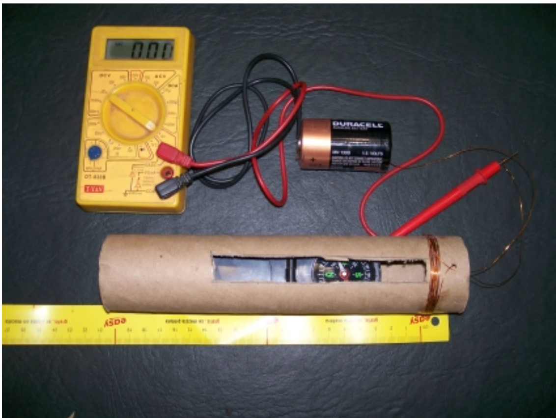
Figura 1.- Se observa el magnetómetro, las conexiones y el multímetro para medir la corriente.

En muchos casos el problema es que el campo generado es muy intenso y conviene alejar la brújula, de forma tal que se debe preparar el dispositivo para correr la brújula unos 5 cm o 10 cm. La construcción y disposición final, se muestran en la figura 1. La pila y el multímetro conviene colocarlos alejados para minimizar los efectos de campos parásitos.