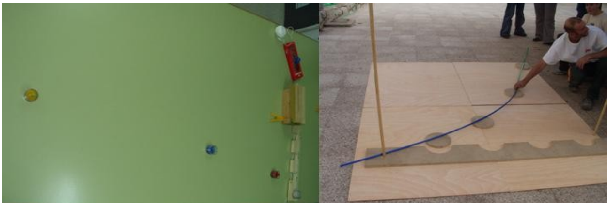
Figura 2.- Después de chocar la regleta con el obstáculo salen las tres velas con sus correspondientes velocidades v_i , recorriendo distintas distancias s_i . La figura de la derecha representa el resultado de la experiencia realizada a gran escala en la Feria Madrid es Ciencia de 2003 (Sierra et al. , 2003).

En las expresiones anteriores \mu es el coeficiente de rozamiento cinético entre las chapas/velas y la superficie sobre la que se deslizan; m_i y s_i representan los valores de las masas y los desplazamientos respectivos ( i=1,2,3 ).