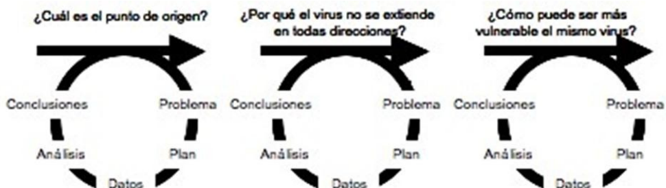
Figura 3.- Ciclos de investigación

Se solicita que los alumnos identifiquen las situaciones, que son reconocibles, y no necesitan directamente la abstracción a las fases del ciclo de investigación estadística que desconocen. Pero en la descripción de las situaciones los alumnos enumeran las acciones que se realizan. Estas descripciones están directamente relacionadas con cada uno de los elementos que configuran las fases del ciclo de investigación (que se pueden consultar en la sección Los ciclos de investigación estadística ). Queda como trabajo del profesor mediar para que los alumnos organicen la información para formalizarla en las fases del ciclo de investigación. Tal y como concluíamos en el análisis del contenido se presentan tres ciclos de investigación, que se pueden representar (Figura 3).