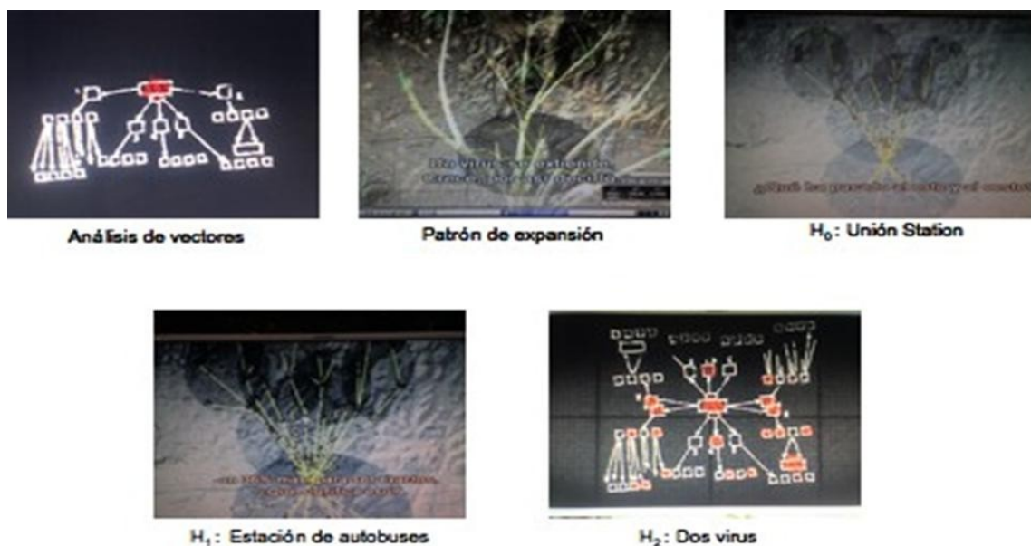
Figura 4.- Transnumeración. Tipo fundamental de pensamiento estadístico.

La ampliación del número de datos permite generar nuevas hipótesis que permiten interrogarse y decidir qué considerar, y que descartar. Estos procesos se presentan en el capítulo a partir del análisis de los gráficos de proyecciones de enfermos, y la búsqueda de relaciones que de entrada están escondidas. Este proceso es una simplificación de la propuesta establecida por Wild and Pfannkuch (1999) sobre transnumeración . Estos autores crearon el término porque algunas veces en la organización y análisis de los datos, una representación particular de los datos puede revelar enteramente nuevas o diferentes características que estaban previamente escondidas. Estas características escondidas pueden tener un mayor impacto en cómo se interpretan los datos en un contexto particular. La siguiente serie de fotografías (Figura 4) presenta esta idea de transnumeración que permite superar ciertas dificultades en la descripción de las hipótesis y su interpretación.