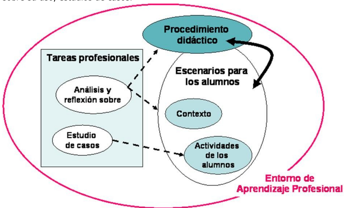
Figura 1.- Entorno de aprendizaje profesional

Este marco para la enseñanza se ha utilizado, a su vez, para estructurar el contenido del curso de formación EarlyStatistics (Meletiou-Mavrotheris y otros, 2008). El curso se configura como parte de un entorno profesional de aprendizaje (Figura 1) que dota al profesor de escenarios de aprendizaje de los alumnos, procedimientos didácticos sobre su uso, estudios de casos.